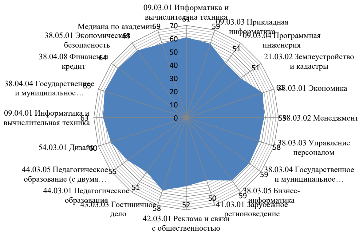
Рисунок 4 – Сводные результаты самообследования основных образовательных программ высшего образования (в баллах)

является построение рейтинга образовательных программ. Ранжирование осуществляется по количеству набранных баллов рисунок 4 и таблица 4.