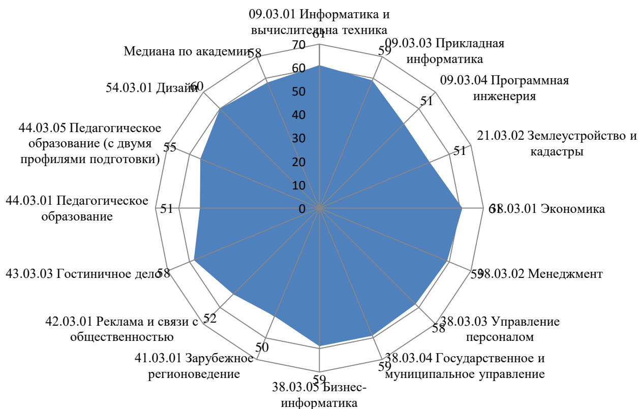
Рисунок 1 – Сводные результаты самообследования основных образовательных программ высшего образования (в баллах)

Результаты, представленные на рисунке 1 позволяют заключить, что при медианном значении по академии в 58 баллов, по 9 из 14 основных образовательных программ высшего образования (уровень бакалавриата) превышают медианное значение, 5 образовательных программ с показателями ниже медианных значений: 09.03.04 Программная инженерия – 51 балл; 21.03.02 Землеустройство и кадастры – 51 балл; 41.03.01 Зарубежное регионоведение – 50 баллов; 42.03.01 Реклама и связи с общественностью – 52 балла; 44.03.01 Педагогическое образование – 51 балл; и 44.03.05 Педагогическое образование (с двумя профилями подготовки) – 55 баллов, что обусловлено отсутствием выпуска, и как результат, не возможностью выполнения ряда требований, таких как анкетирование обучающихся, анкетирование работодателей и пр. С целью понимания доли соблюдения критериальных значений по основной образовательной программе высшего образования, на рисунке 2 приведены сводные результаты процента выполнения показателей.