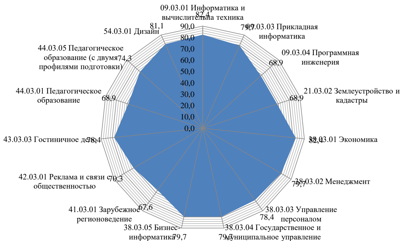
Рисунок 2 – Сводные результаты самообследования основных образовательных программ высшего образования уровень бакалавриат (в %)

Результаты, представленные на рисунке 2 позволяют заключить, что при медианном значении по академии в 78%, по 9 из 14 основных образовательных программ высшего образования (уровень бакалавриата) превышают медианное значение от 1 до 4% максимальное значение отмечено по основным образовательным программам направлений подготовки 09.03.01 Информатика и вычислительная техника и 38.03.01 Экономика, 5 образовательных программ с показателями ниже медианных значений по академии, что также подтверждает ранее установленную причину –отсутствие выпуска. Теме не менее, полученные результаты указывают на полное соблюдение критериальных значений, по основным образовательным программам высшего образования.