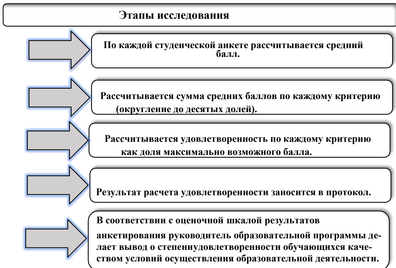
Рисунок 3.1– Алгоритм оценки показателей, характеризующих удовлетворенность обучающихся качеством ресурсного обеспечения образовательной деятельности

арифметические) оценки каждого из 16 изучаемых показателей, по 5 укрупненным группам и выведена общая удовлетворенность качеством предоставления образовательных услуг. Все средние оценки определялись только с учетом мнения респондентов, ответивших на вопрос. В итоге были сформированы протоколы по каждой образовательной программе.