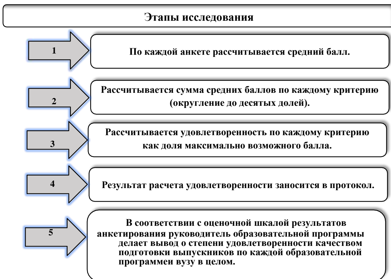
Рисунок 3 – Алгоритм оценки показателей, характеризующих удовлетворенность работодателей качеством подготовки выпускников, осваивающих основные профессиональные программы высшего образования

После завершения опроса была произведена обработка полученных данных. При обработке результатов анкетирования получены средние (средне- арифметические) оценки каждого из 10 изучаемых показателей, по 3 укрупненным группам и выведена общая удовлетворенность качеством подготовки выпускников программы. Все средние оценки определялись только с учетом мнения респондентов, ответивших на вопрос. В итоге были сформированы протоколы по каждой образовательной программе, рисунок 3