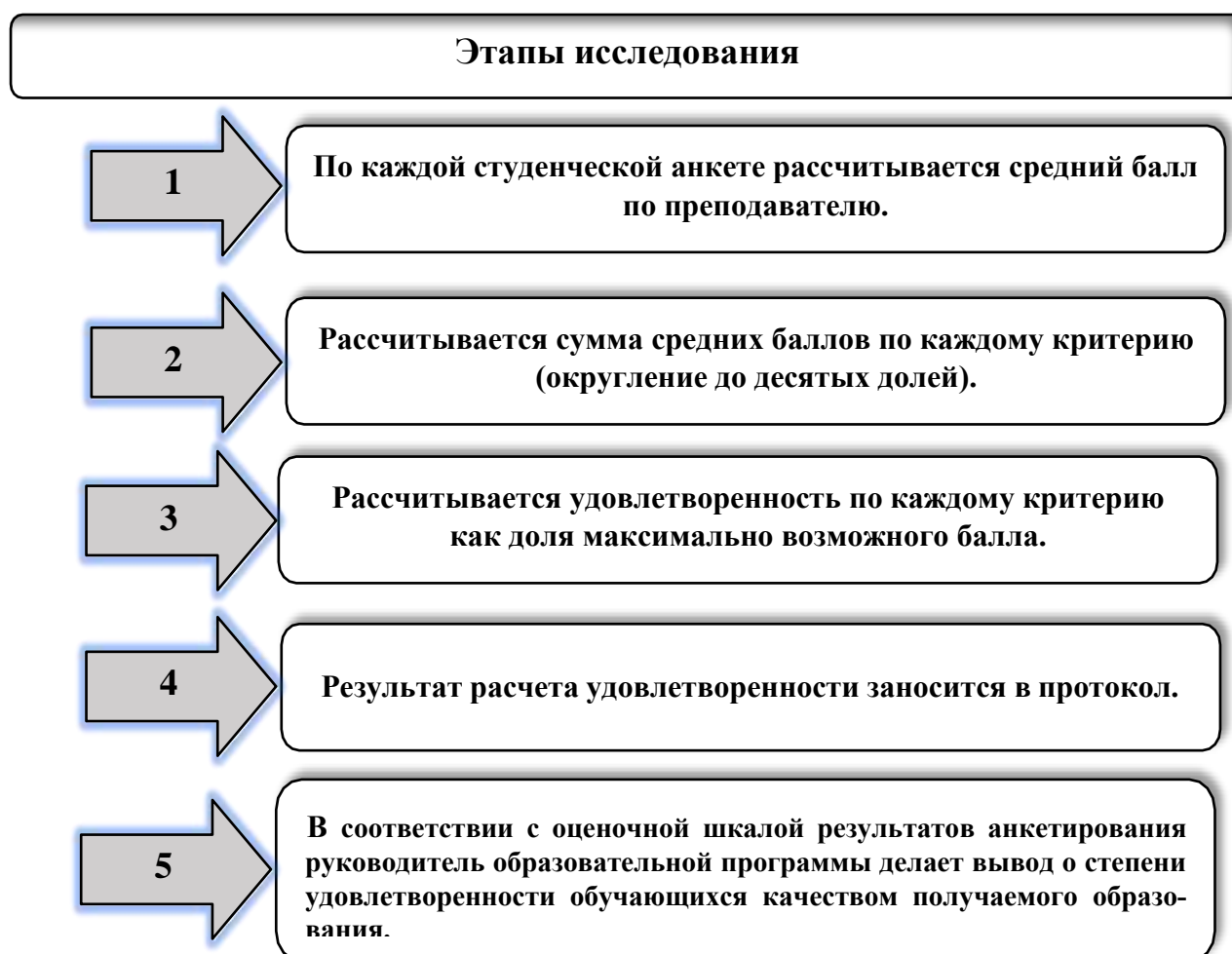
Рисунок 2 – Алгоритм оценки показателей, характеризующих работу научно-педагогических работников академии обучающимися, осваивающими основные профессиональные программы высшего образования

Этапы исследования отражены на рисунке 2. Все средние оценки определялись только с учетом мнения респондентов, ответивших на вопрос. В итоге, всего были оценены обучающимися 156 преподавателей и сформированы протоколы по каждому НПР.