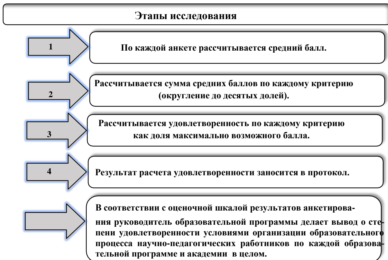
Рисунок 3.2– Алгоритм оценки показателей, характеризующих удовлетворенность научно-педагогических работников качеством ресурсного обеспечения образовательной деятельности

ным группам и выведена общая удовлетворенность качестве ресурсного обеспечения образовательной деятельности. Все средние оценки определялись только с учетом мнения респондентов, ответивших на вопрос. В итоге были сформированы протоколы по каждой образовательной программе.