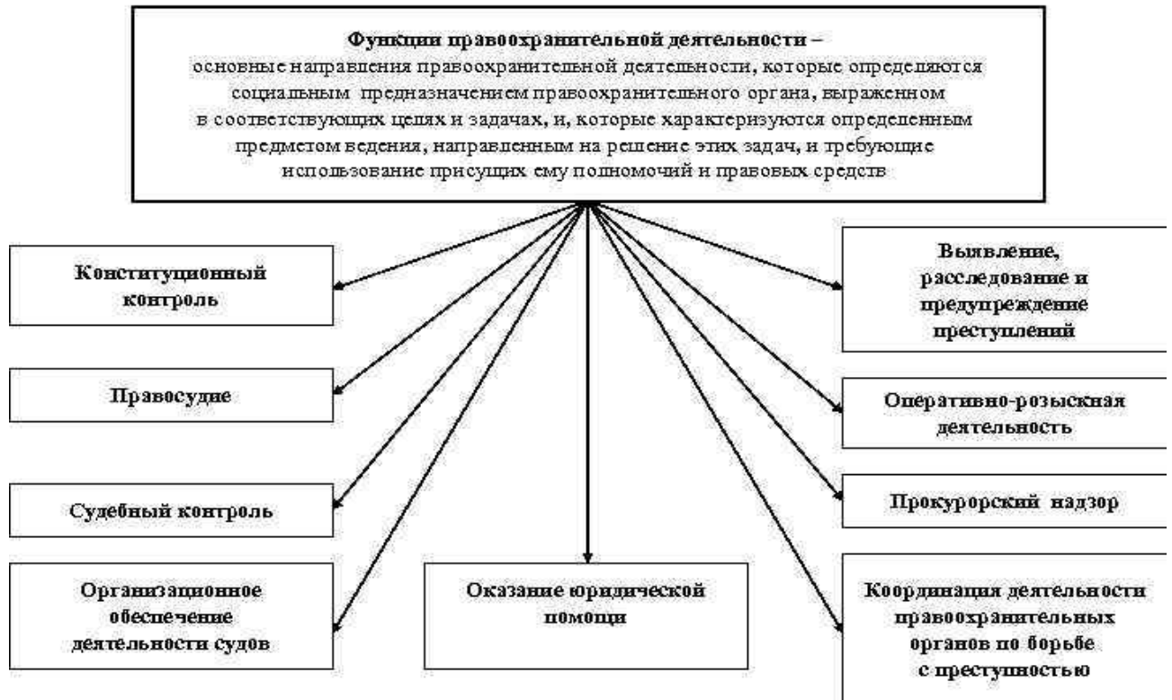
Рисунок 1 – Функции правоохранительной деятельности